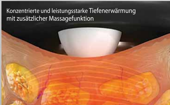
Konzentrierte und leistungsstarke Tieferwärmung mit zusätzlicher Massagefunktion

Alle Behandlungsarten sind sicher, effektiv und für alle Hauttypen (I-VI) sowie auch für dünne und sensible Körperareale geeignet.